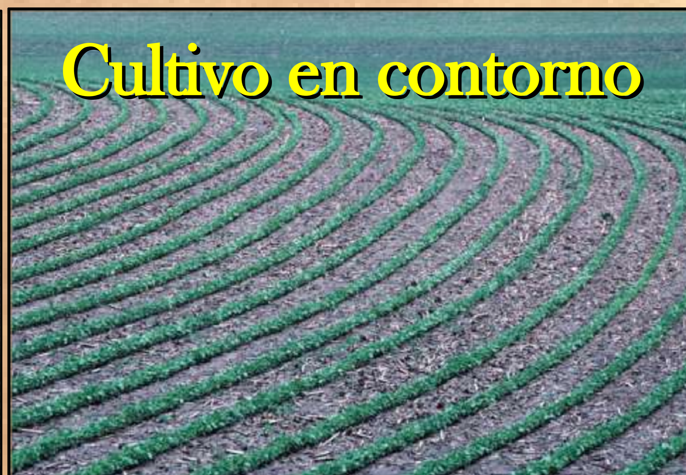
Cultivo en contorno