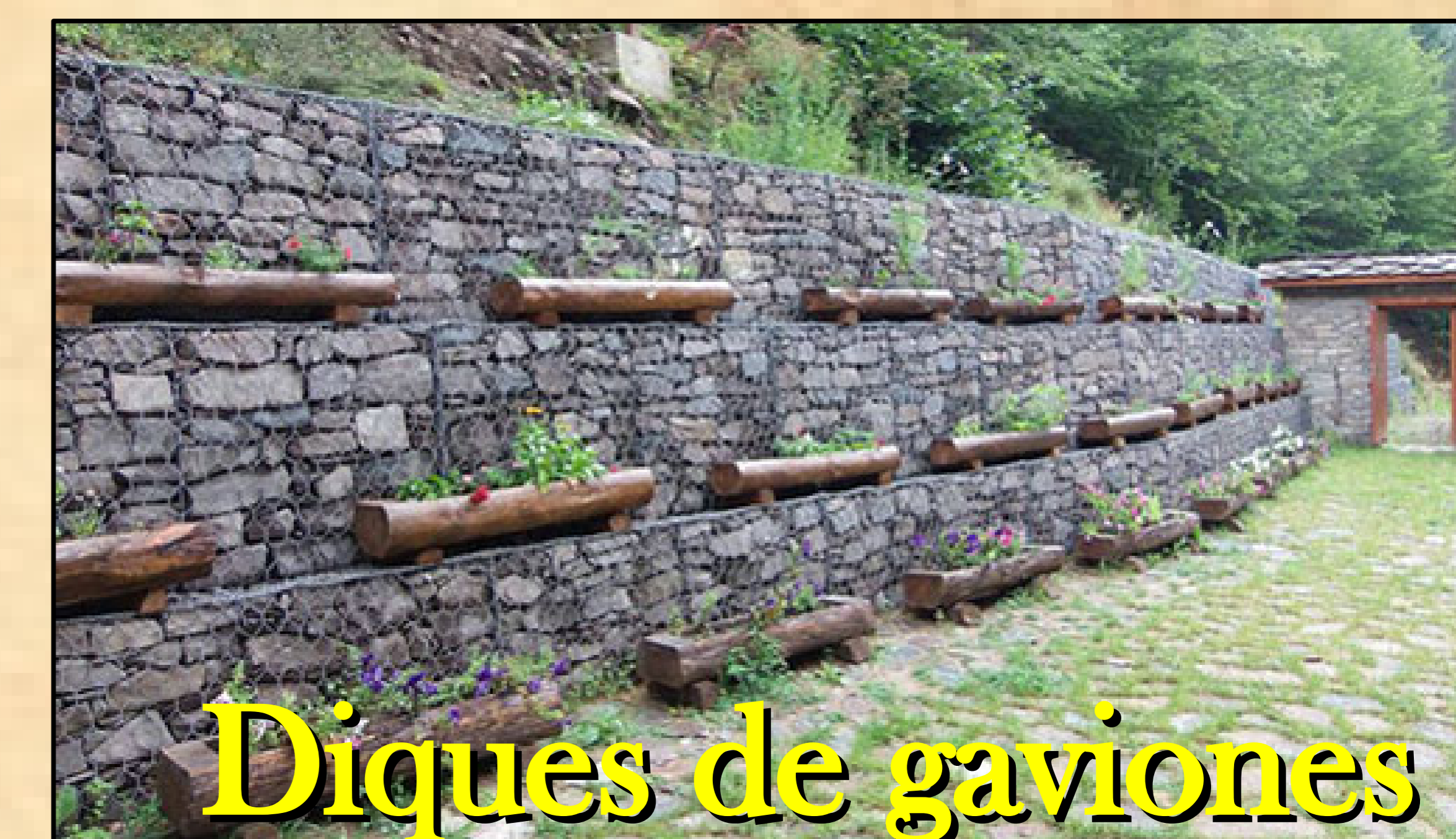
Diques de gaviones