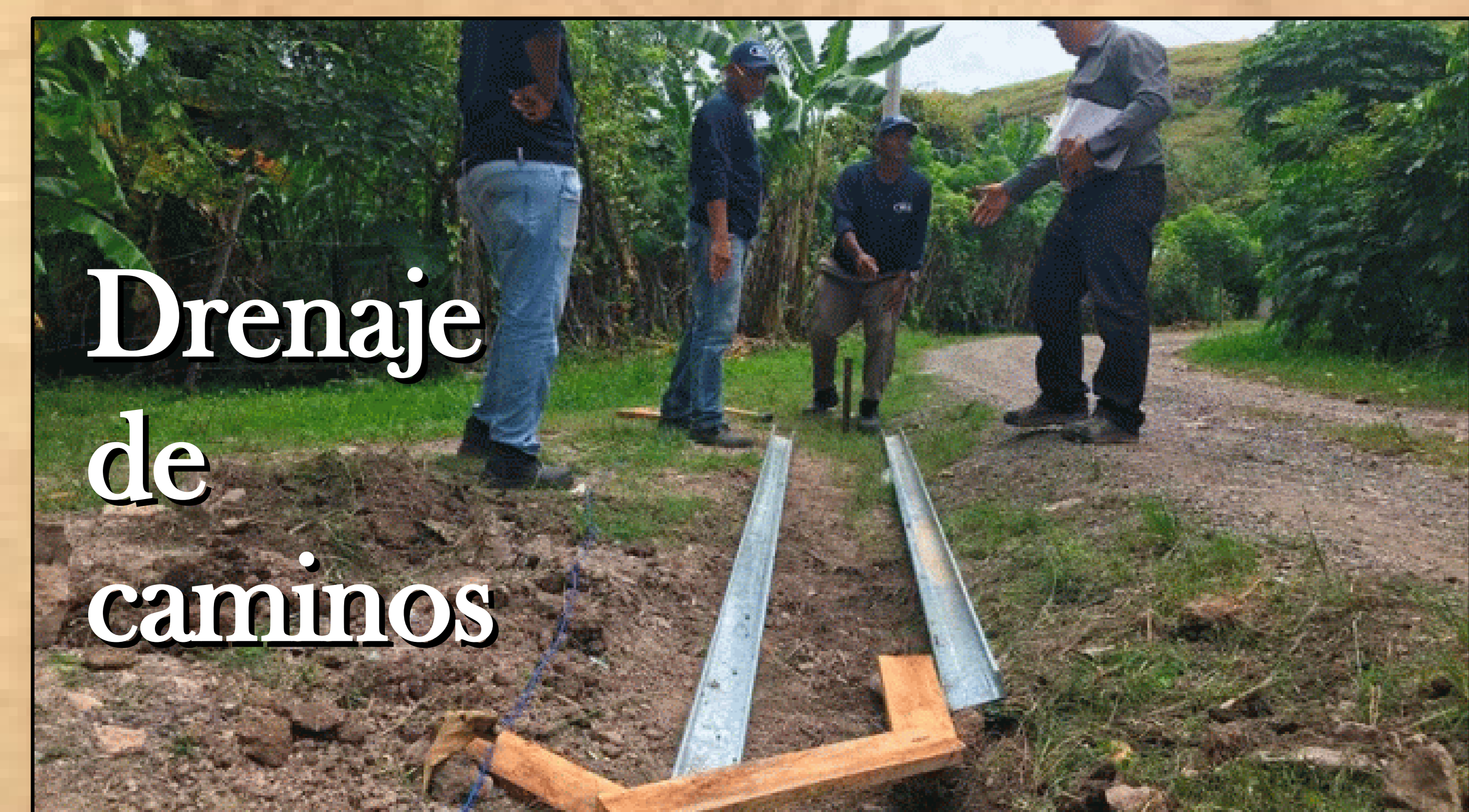
Drenaje de caminos