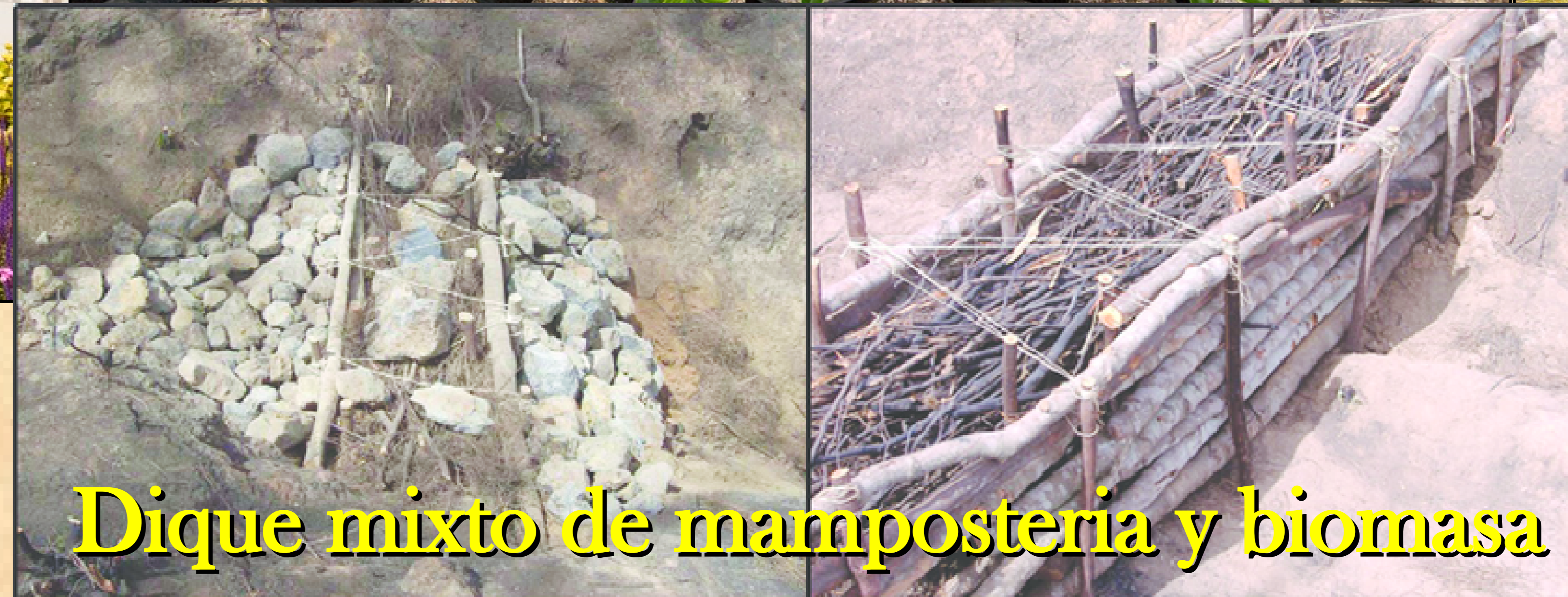
Dique mixto de mampostería y biomasa