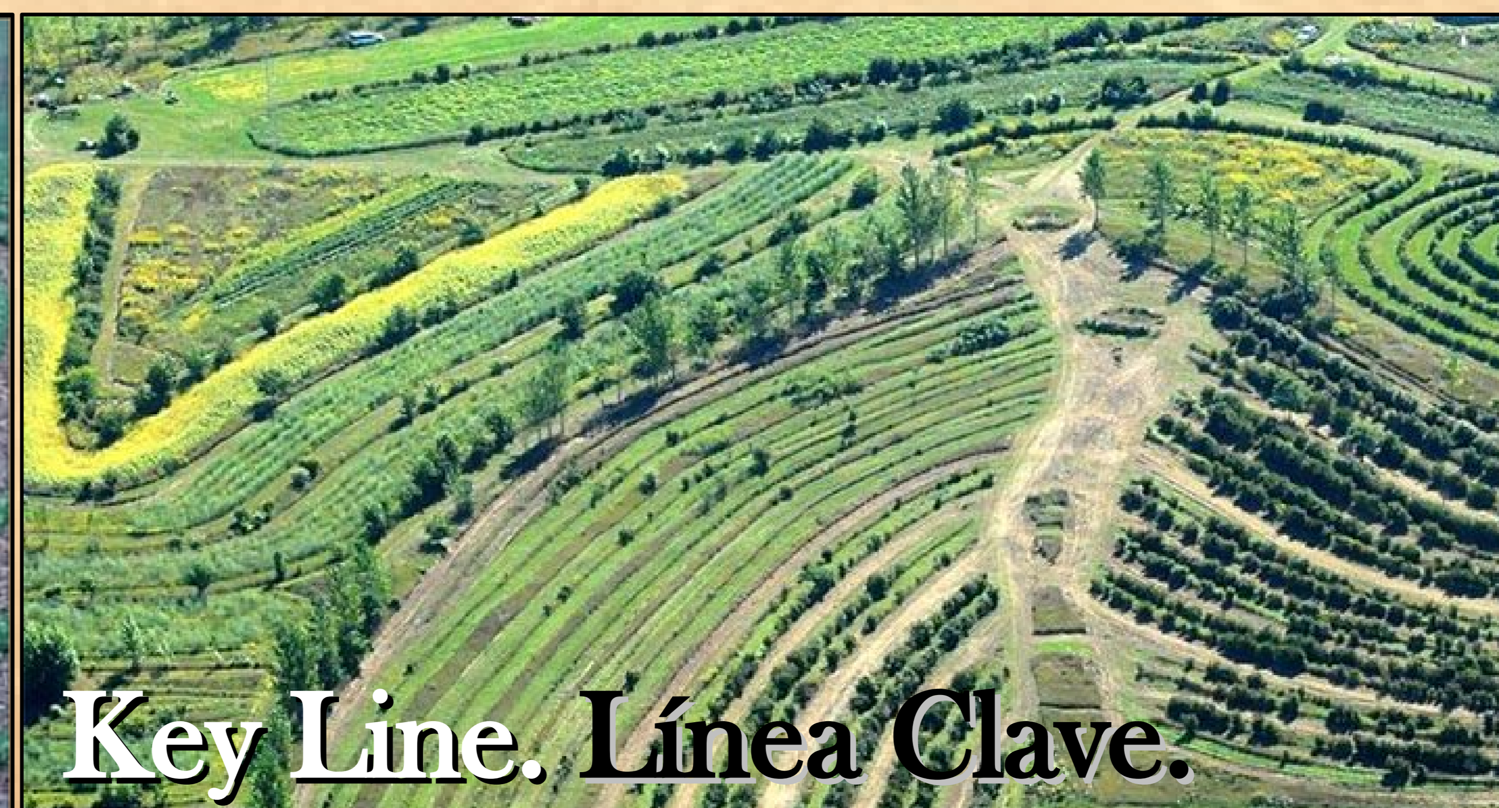
Key Line. Línea Clave.