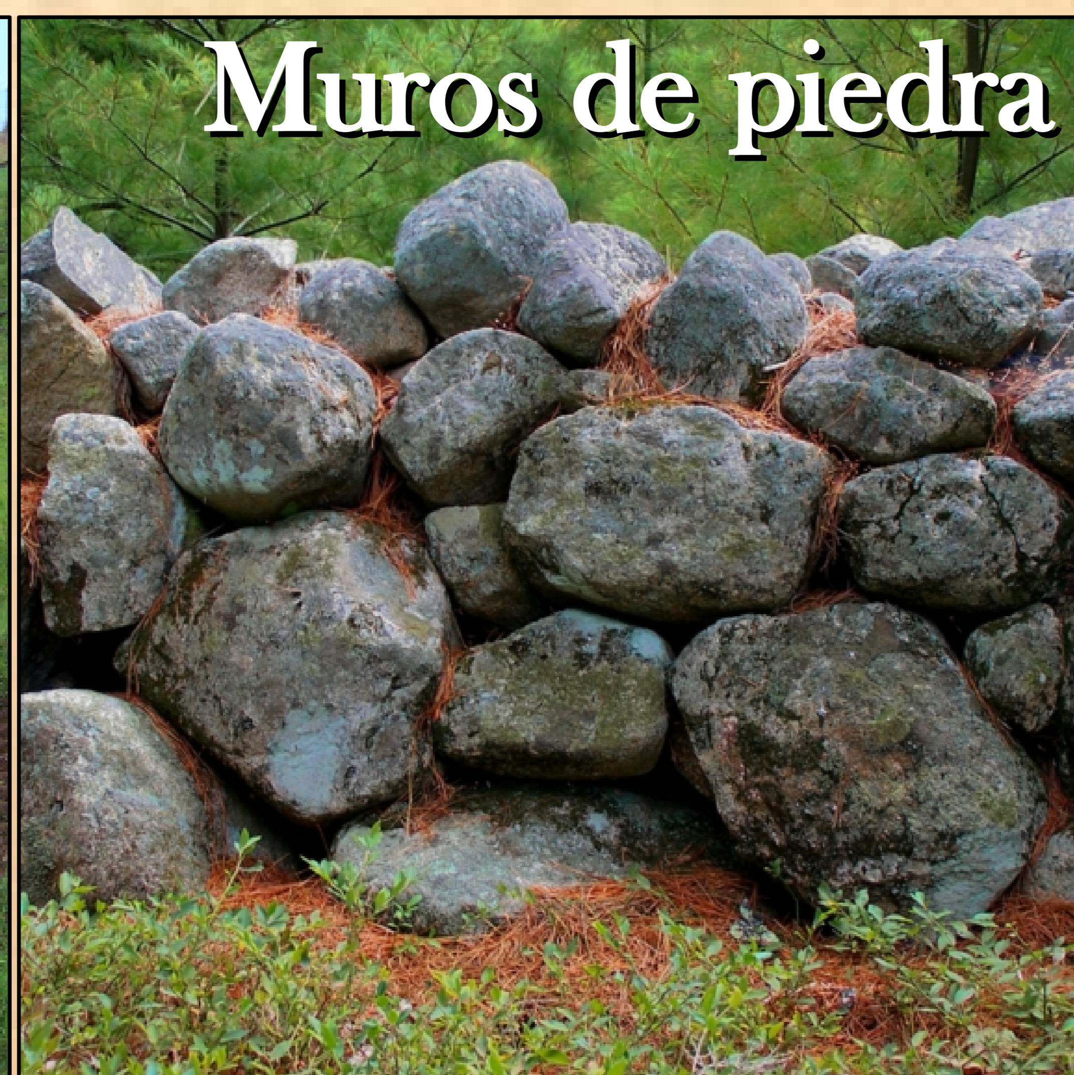
Muros de piedra