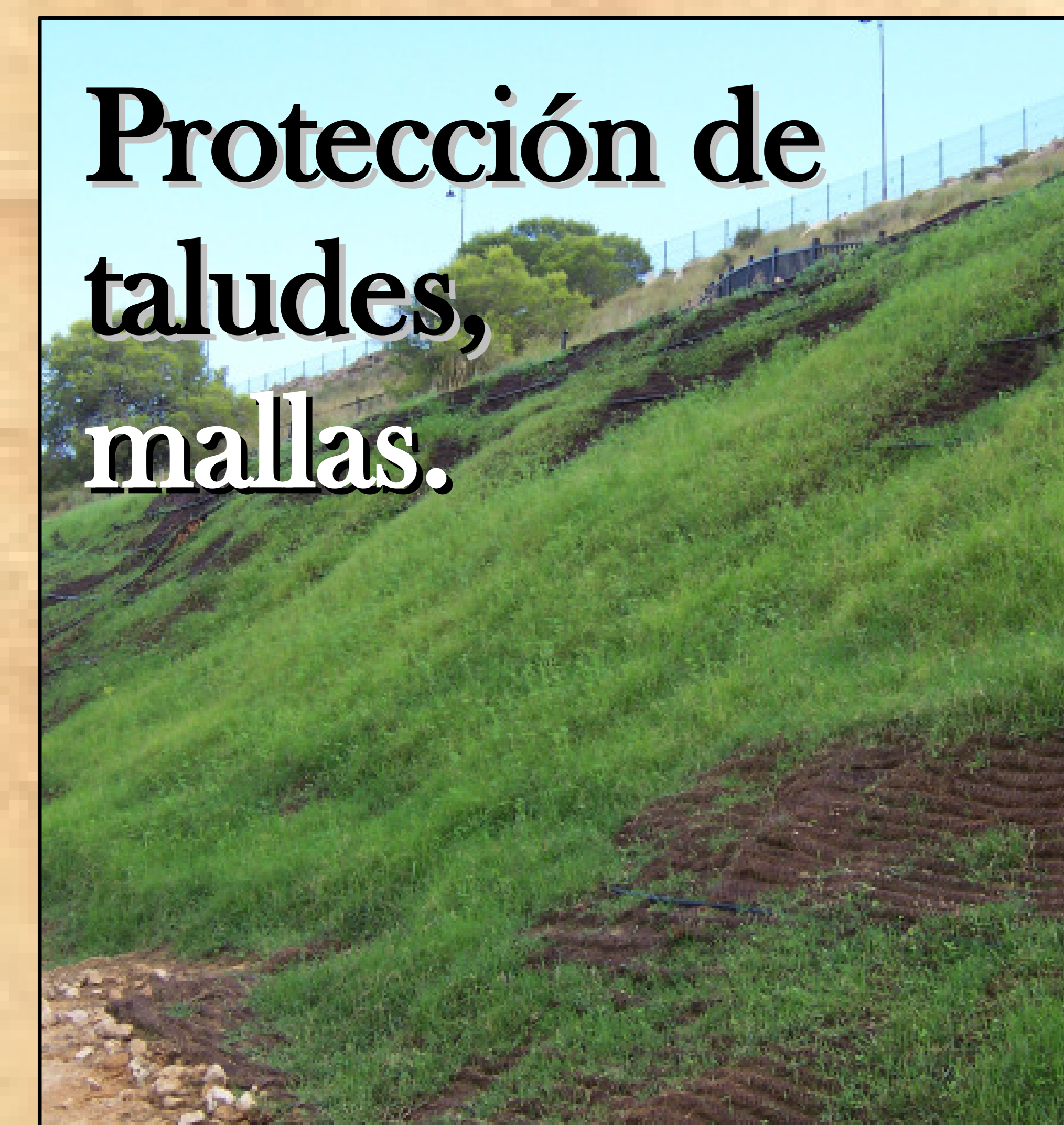
Protección de taludes, mallas.