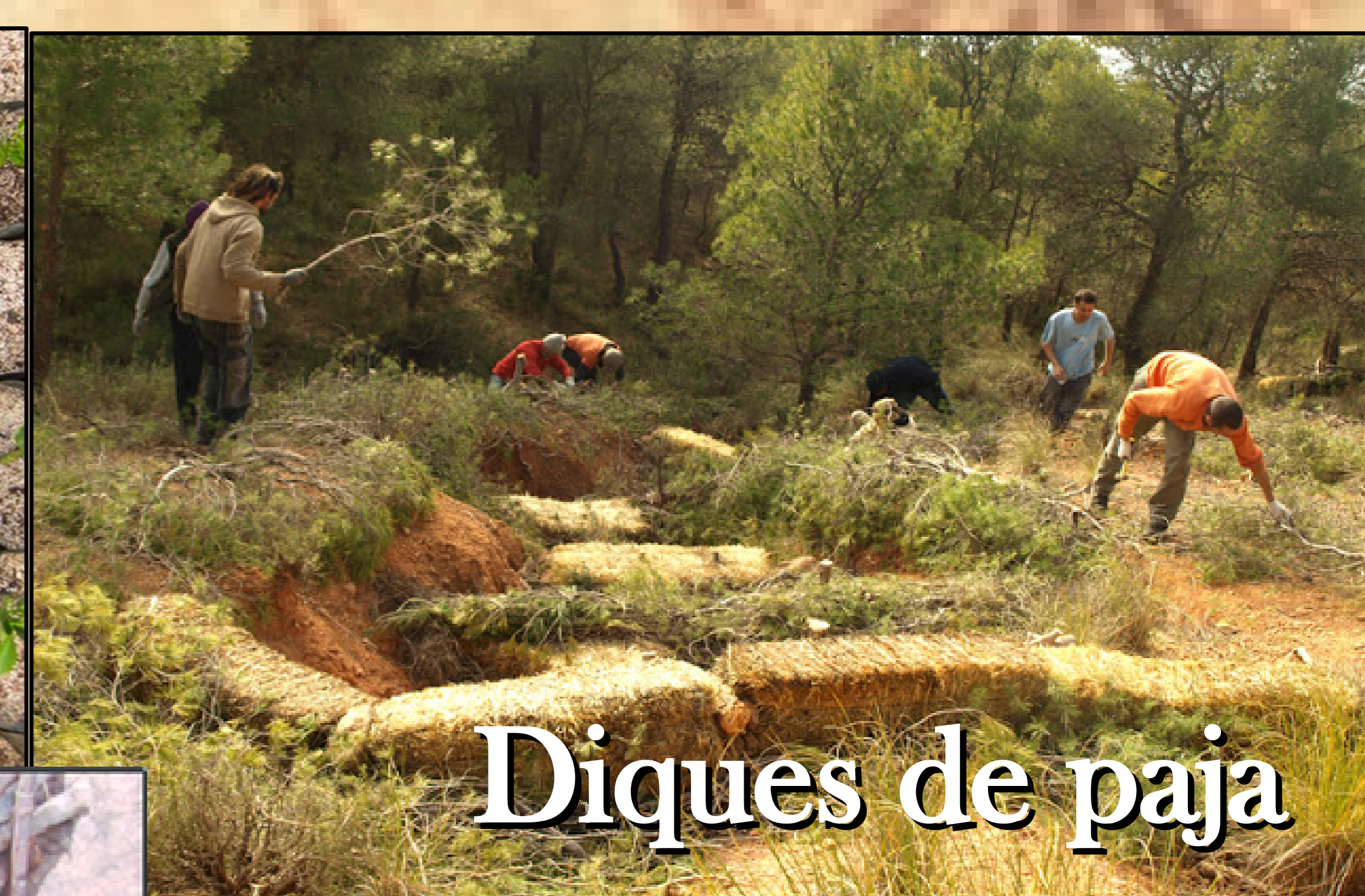
Diques de paja