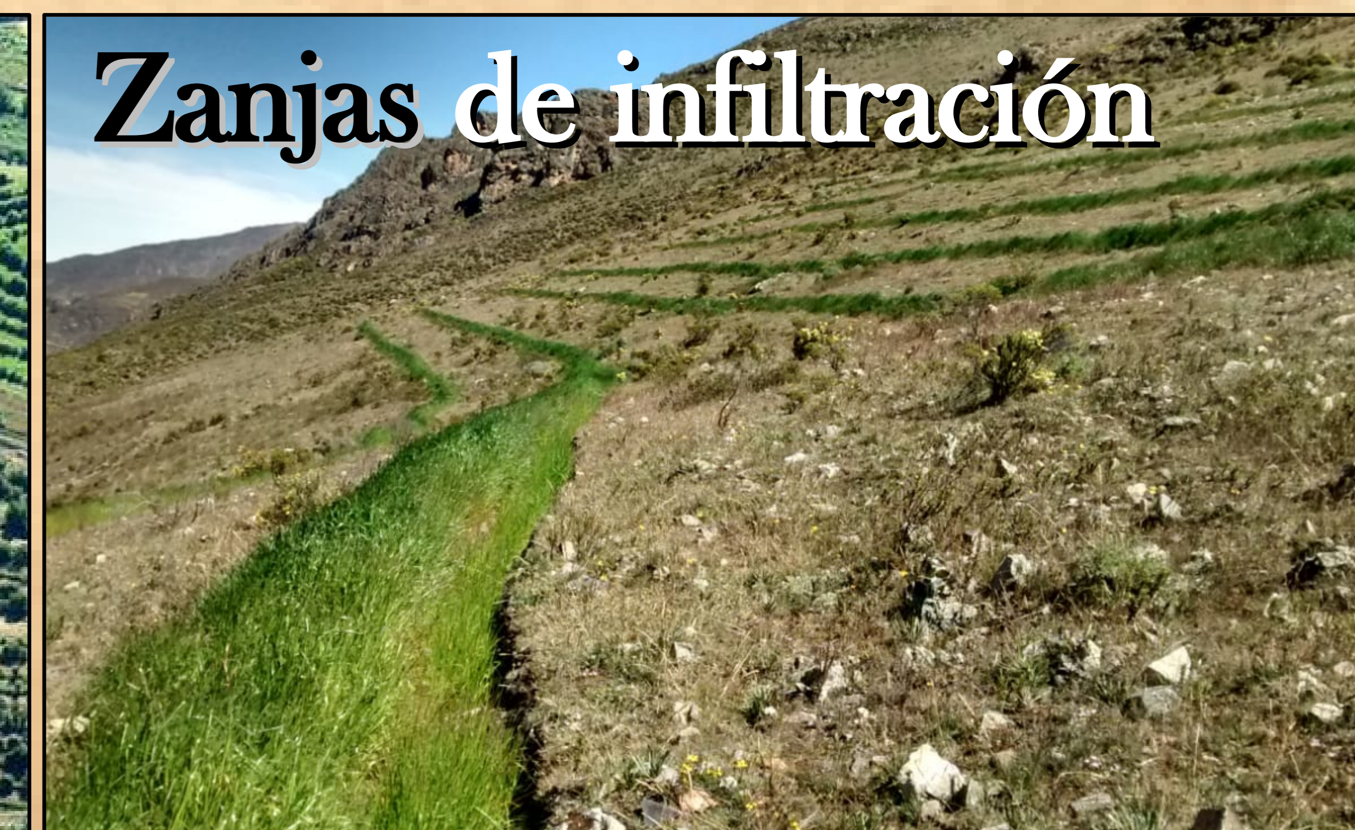
Zanjas de infiltración