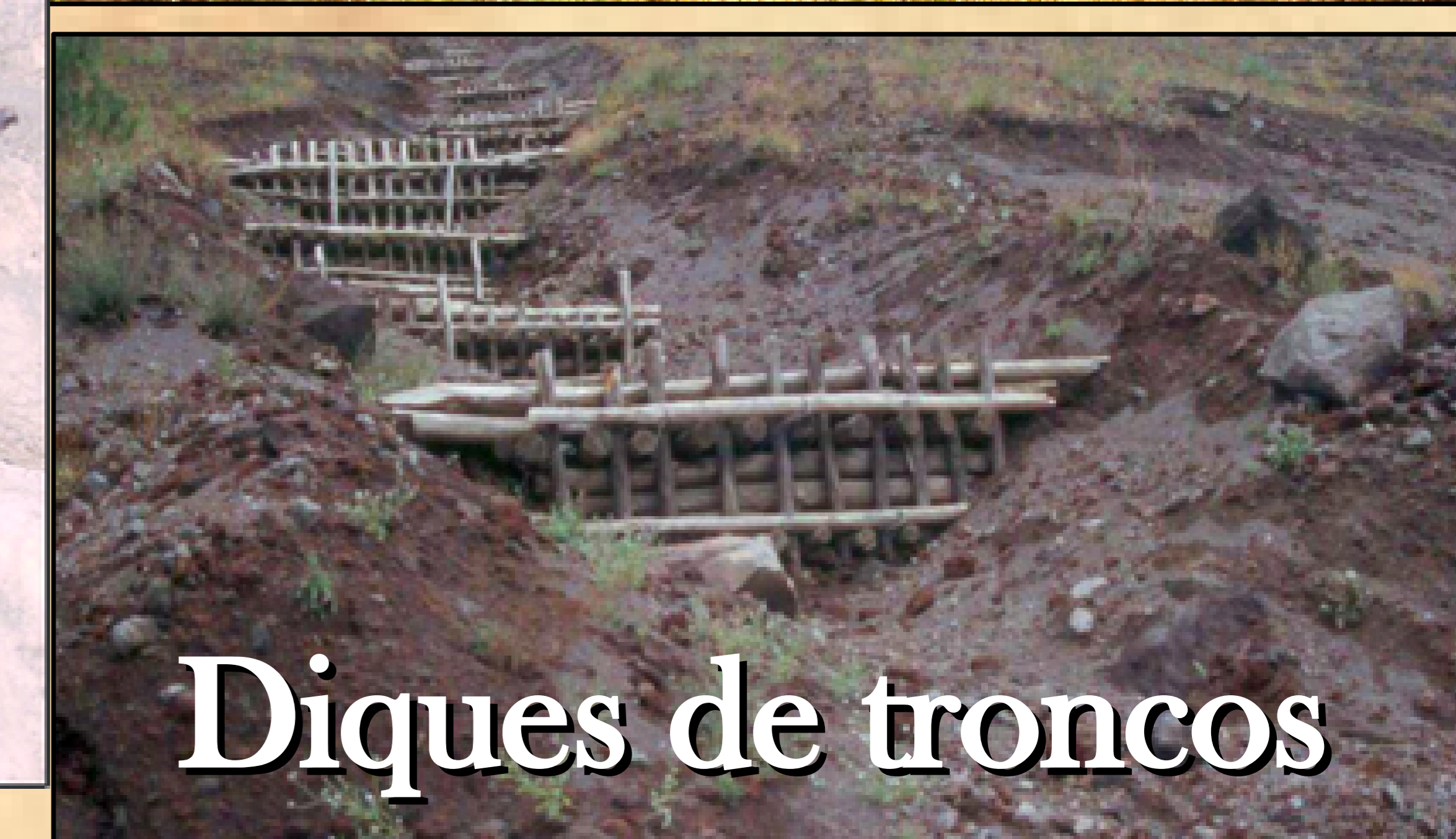
Diques de troncos