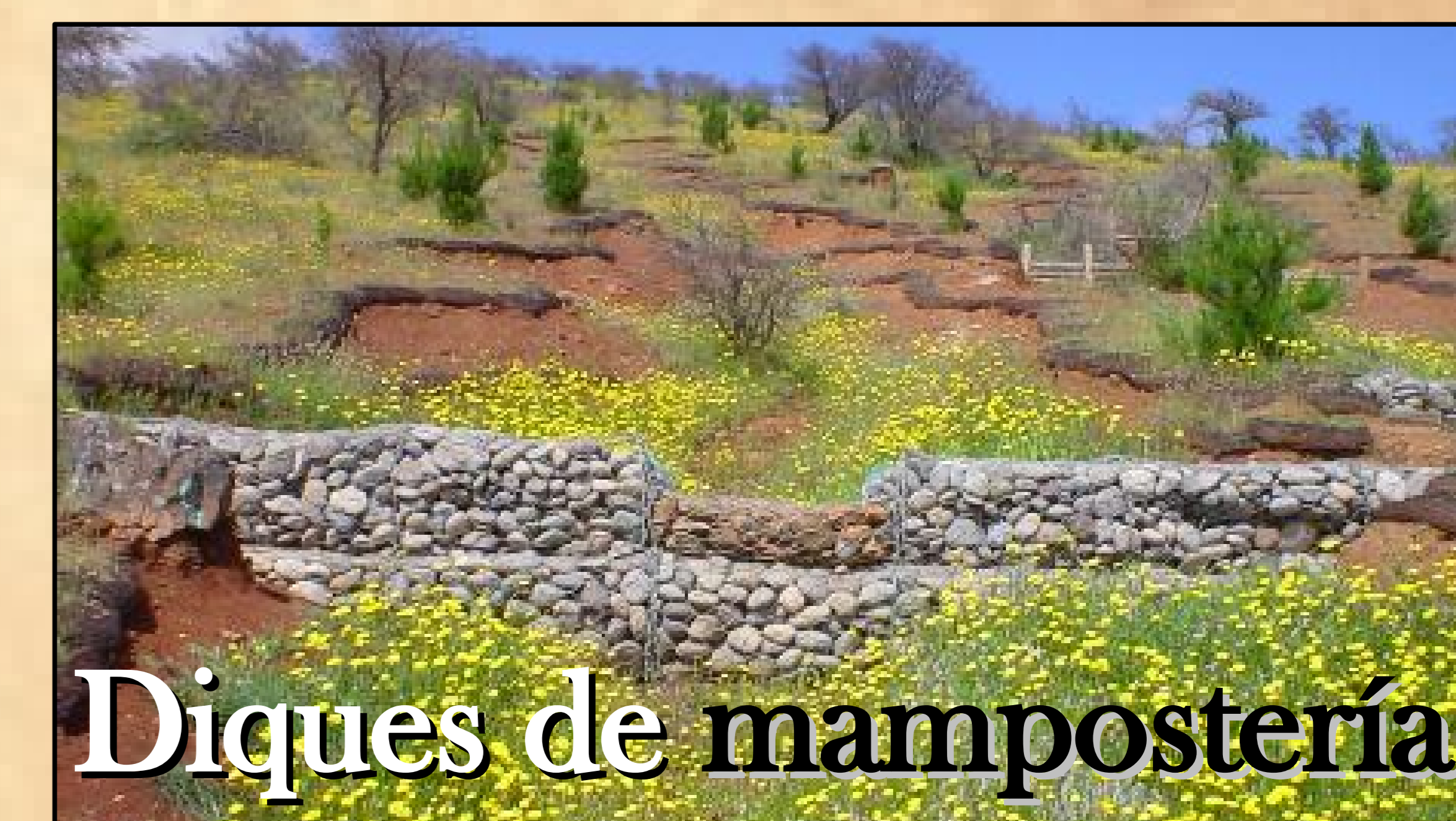
Diques de mampostería