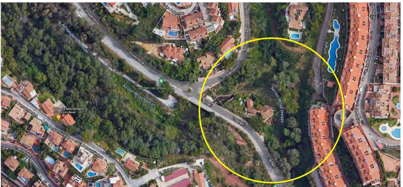
Zona Club de pesca factible de ampliar Acuerdo de CdT para observatorio, centro de visitantes o de EMA