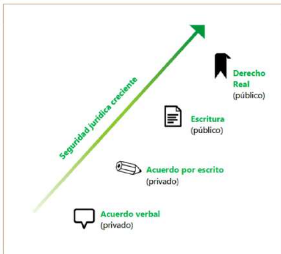
Figura Seguridad jurídica de los acuerdos de custodia del territorio